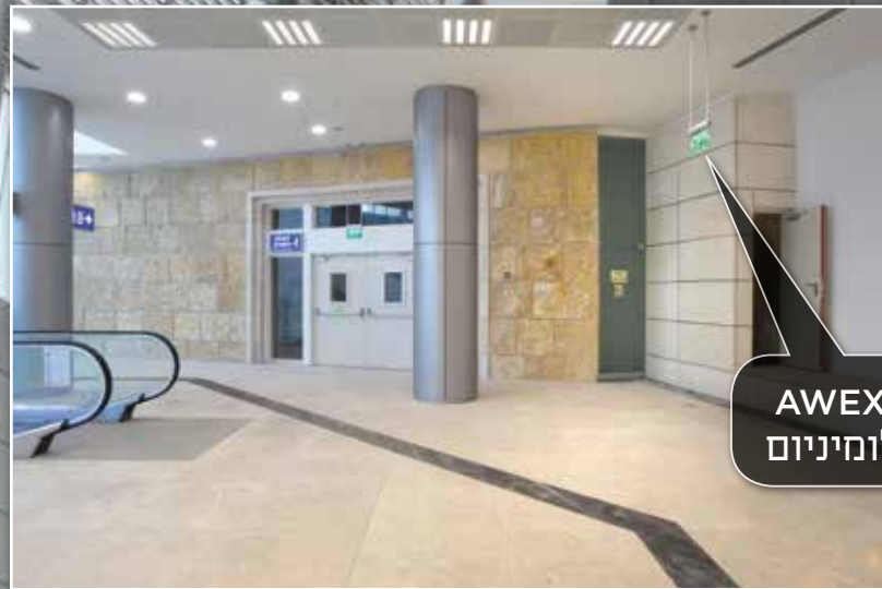
שלט יציאת חירום AWEX TWINS תלייה באמצעות צינורות אלומיניום