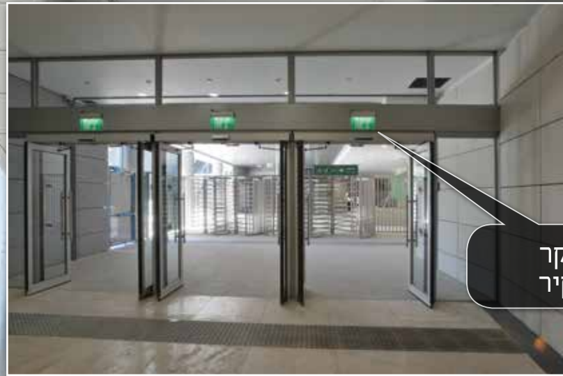
שלט יציאת חירום מבוקר שלט AWEX TWINS צמוד קיר