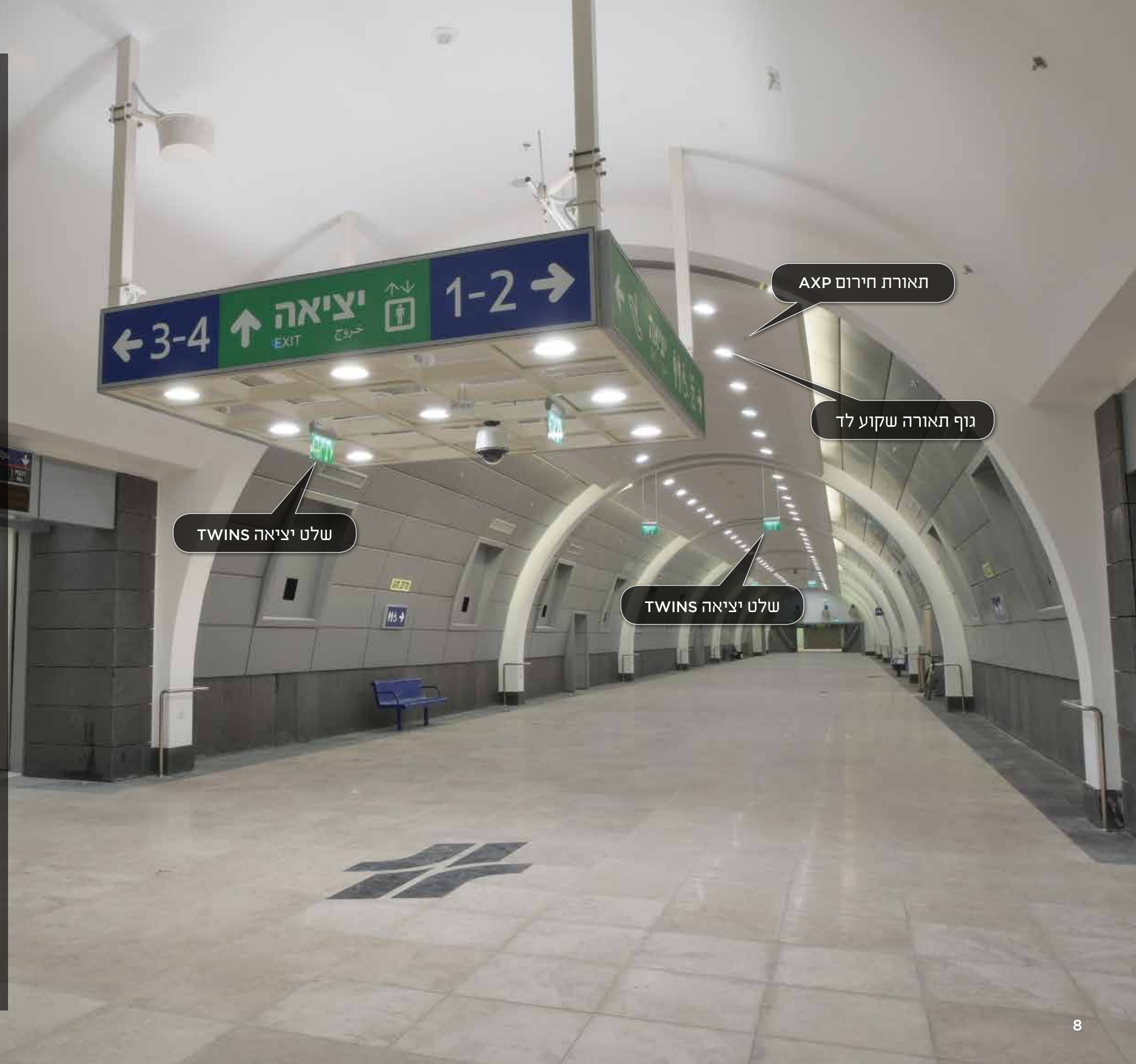
תאורת חירום AXP

גוף תאורה שקוע לד, בתכנון התאורה הושם דגש לתאורה רכה ואחידה.