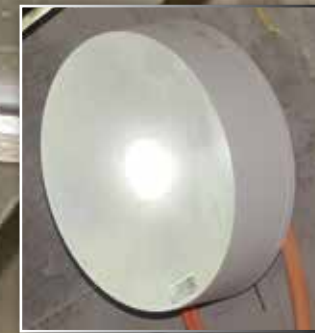
תאורת חירום AXN

גוף תאורה PRIMA פלואורוסנט T5 2x54W, מוגן מים IP65, PC/PC.