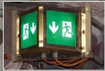
שלט יציאת חירום

תאורת ביטחון: (לאורך הקיר מימין), תאורת הצפה לד, לתגבור התאורה באזור מצלמות האבטחה.