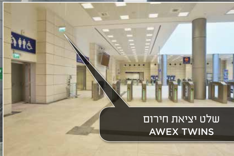
שלט יציאת חירום שלט AWEX TWINS