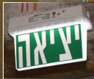
שלט יציאה HELIOS DS