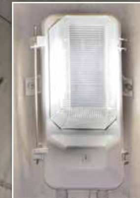
גוף תאורת חירום